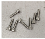
Figure 1: VIS CHC M3X12 DINOX A4