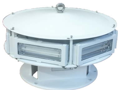
EP 1966535B1 & US 7816843

Option fourni avec GPS (synchronisation des éclats)