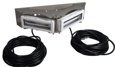
EP3230651, FR1462349, Pat. 10,247,386