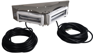
EP3230651, FR1462349, Pat. 10,247,386