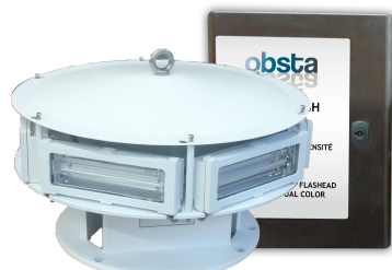
EP 1966535B1 & US 7816843