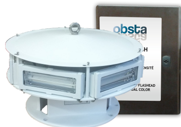
EP 1966535B1 & US 7816843